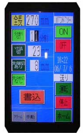
タッチパネル運転画面